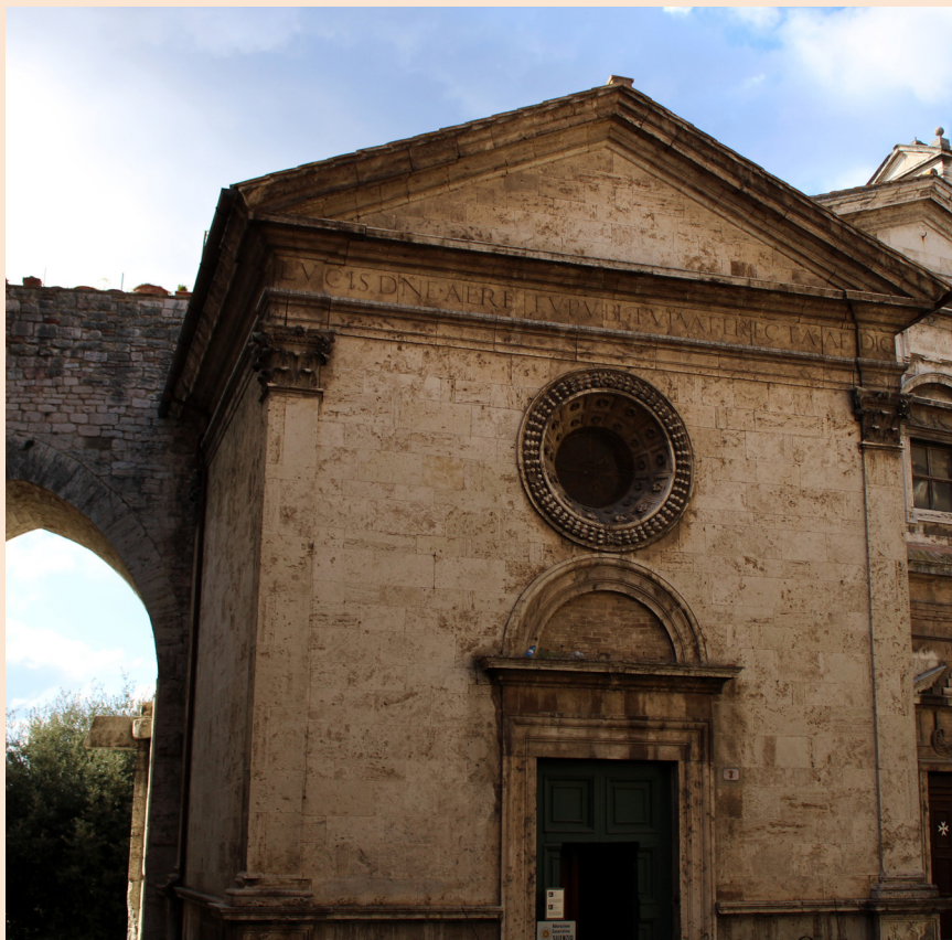
La chiesa di Madonna della Luce, in Perugia.

Lo dico subito a mio marito: «Ma come? Vuoi lasciare l'Università? No, non puoi farlo, tu devi fare il concorso!». Ormai sono decisa e, una volta a casa, preparo tutto per il trasloco.