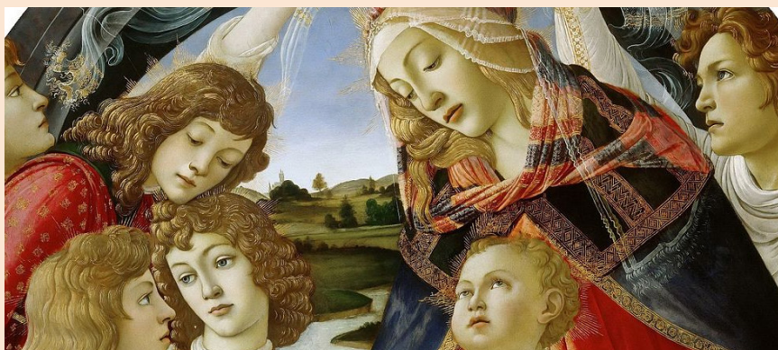
Sandro Botticelli, La Vergine del Magnificat (1485), Galleria degli Uffizi, Firenze.