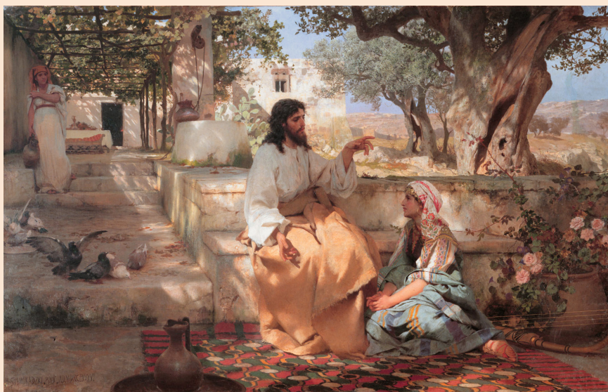
Henryk Siemiradzki, Cristo in casa di Marta e Maria (1886), S. Pietroburgo.