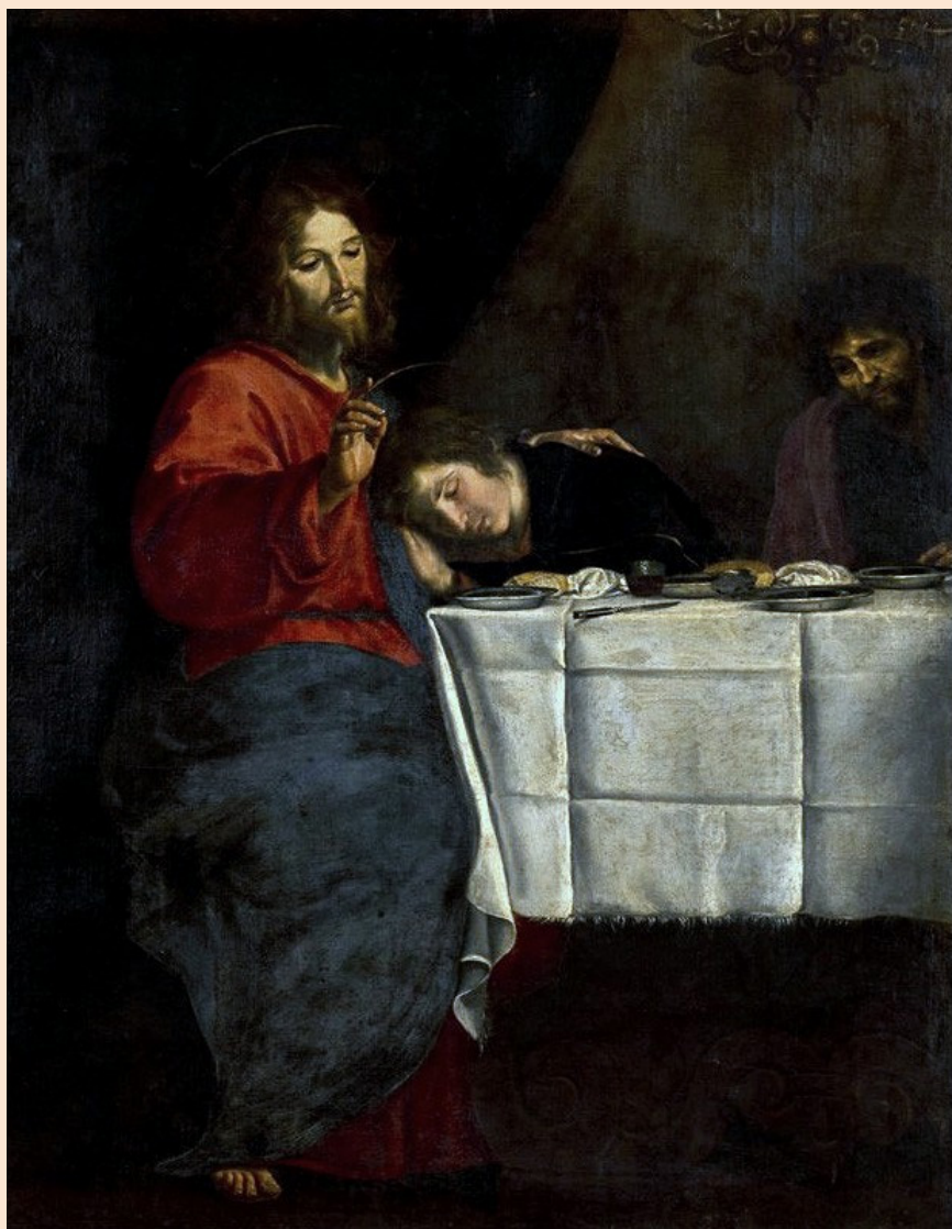
Autore sconosciuto, Ultima cena (1600-1650), Museu Nacional de Belas Artes, Rio de Janeiro.

La Chiesa ci ricorda che "con questa orazione dinanzi a Cristo Signore presente nel Sacramento, i fedeli prolungano l'intima unione raggiunta con lui nella comunione