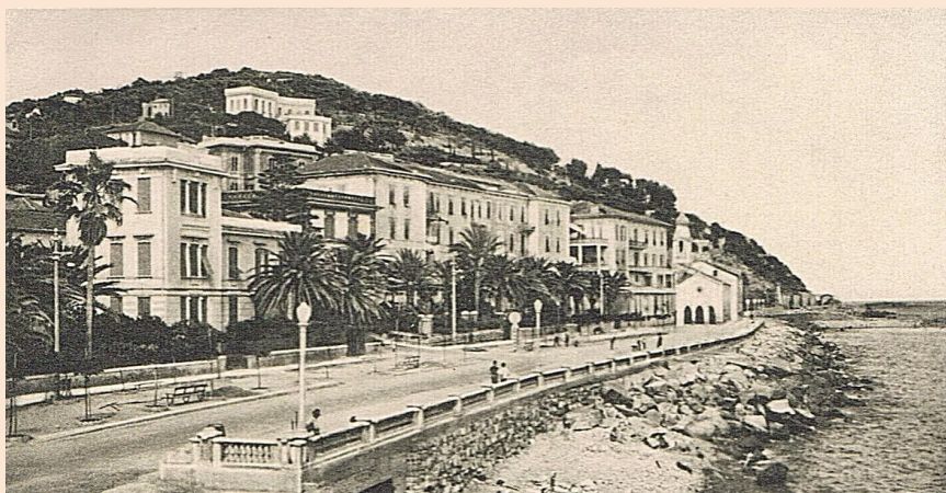
Il litorale di Imperia in una cartolina del secolo scorso.

tutto» ed ella non si lascia trovare titubante; risponde con un «sì» deciso: «Sì, Signore, lascerò tutto per abbracciare sorella povertà». Subito dopo quel «sì» entra una grande gioia nel suo cuore. Sente di dover vivere come gli uccelli del cielo e vestire come i gigli del campo e lo sente come una chiamata di privilegio e che tutto questo le viene dato come dono di offerta per la salvezza di chi si ama. Tornata a casa, annuncia tale decisione a suo marito, il quale le dice che è impazzita. Forse nel suo subconscio l'ha pensato anche lei... Ma, certamente, vuole mantenere la promessa, anche se viene chiamata ad affrontare la richiesta di una separazione consensuale. Racconta di come, accompagnata solo da sua cognata,